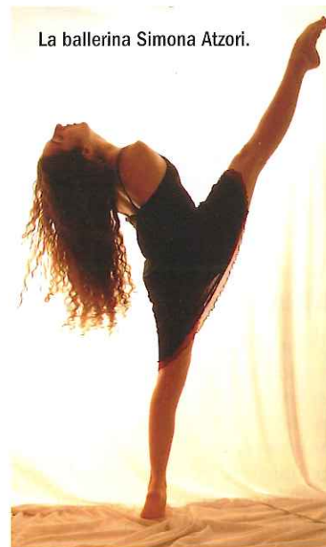
La ballerina Simona Atzori.

La vita è creatività, estro e fantasia. L'essere umano da sempre ricerca, tra i suoi bisogni, l'approfondimento culturale. Un movimento che lascia una traccia, delle orme. E non ha importanza la forma della nostra impronta, sia essa composta da due piedi uniti, dal timbro di una stampella o dalla scia di una carrozzina: ogni persona, se lo desidera, deve poter esprimere la propria creatività, al di là di ogni impedimento di natura fisica. Per questo motivo, già nel 2012, la Federazione ticinese integrazione andicap (Ftia), l'associazione teatro Danz'Abile e l'associazione della Svizzera romanda e italiana contro le Miopatie (Arim) si sono unite allo scopo di dare visibilità alle forme d'arte integrate o proposte da persone con disabilità.